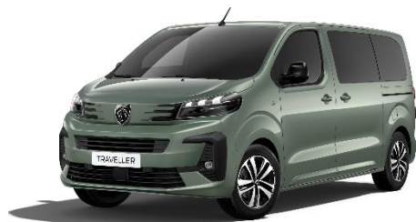
Verde Kapari DUM0 - opzionale