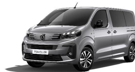
Grigio Artense F4M0 - opzionale