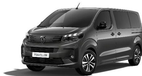
Grigio Titane 1JM0 - opzionale