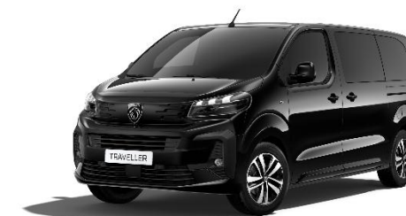
Nero Perla Nera 9VM0 - opzionale