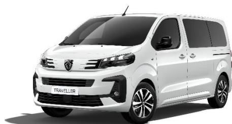
Bianco Kaolin PRP0 - serie