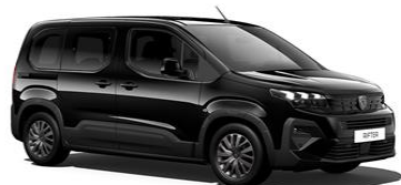
Nero Perla Nera