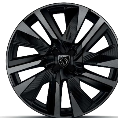
Jantes alliage 18" 'diamantées EVISSA bi-tons Noir Onyx, vernis Black Mist avec inserts Noir Onyx mat