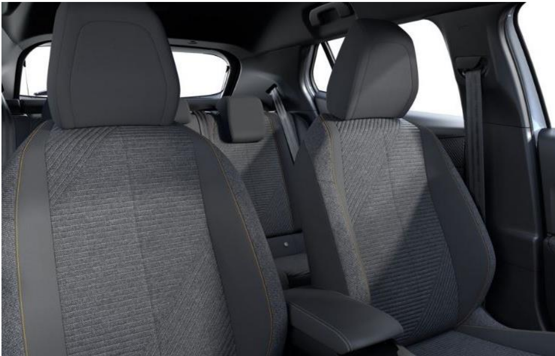
Sellerie tissu RENZO avec surpiqûres Orange Sunrise