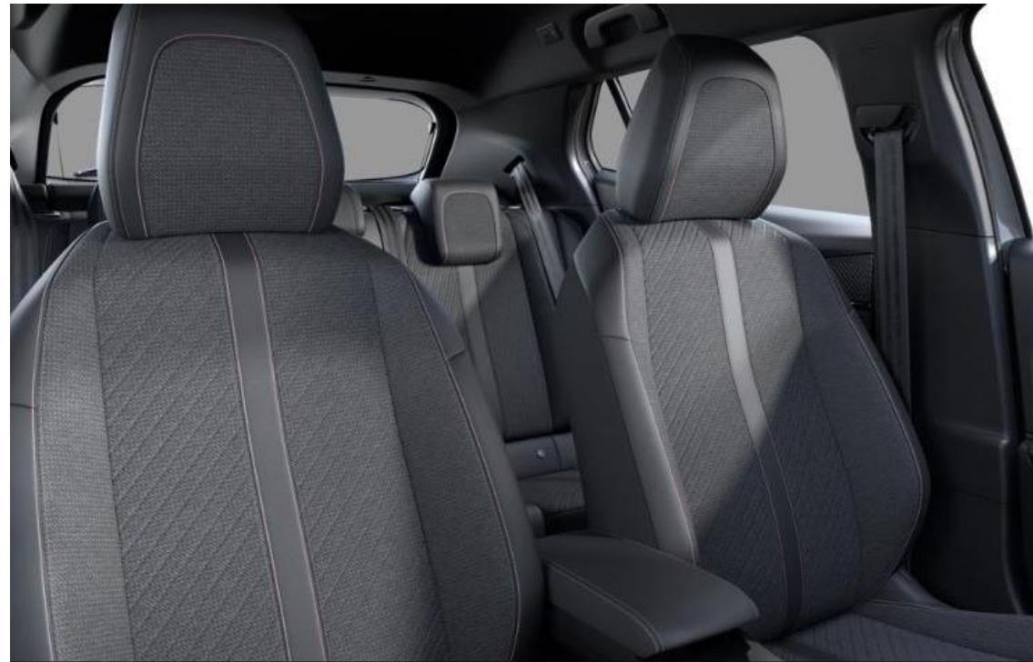
Sellerie tissu CASUAL LOMSA embossé accompagnement TEP Isabella, trimatière Lomsa et surpiqûres Quartz