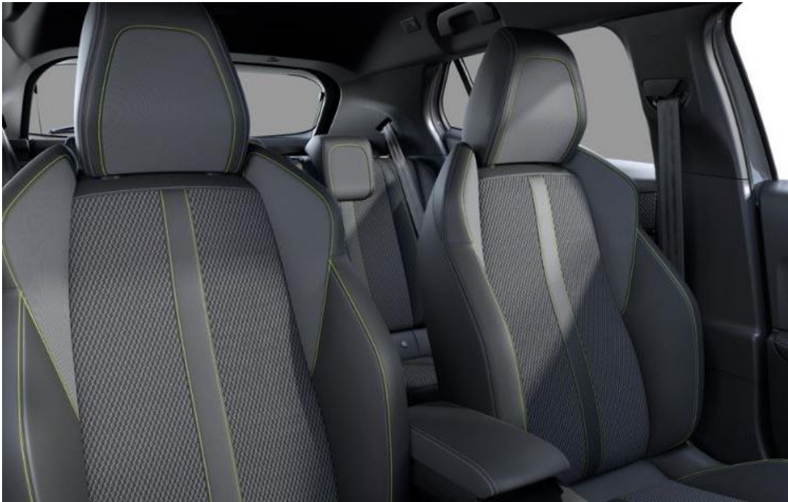
Sellerie tissu BELOMKA, accompagnement TEP Isabella, trimatière Uni Capy et surpiqûres Vert Adamite