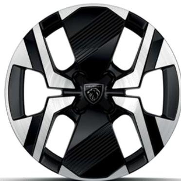
Jantes alliage 17" diamantées KARAKOY bi-tons Noir Onyx et vernis brillant