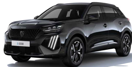
Noir Perla Nera