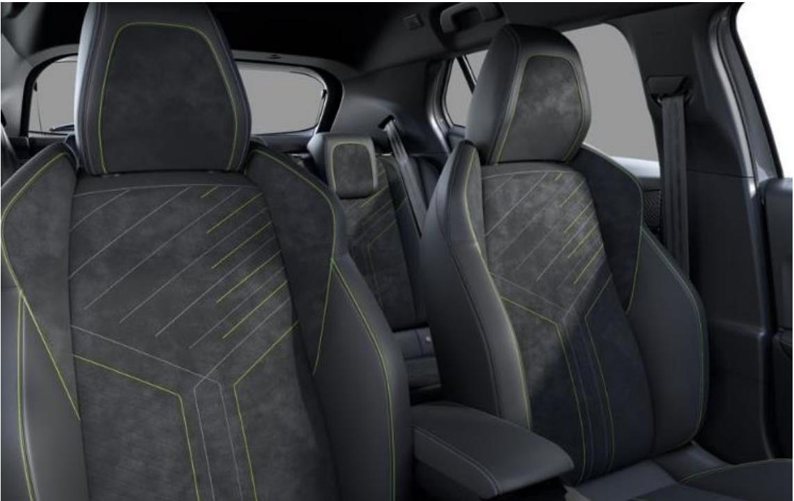
Sellerie Alcantara® Mistral ICONIUM accompagnement TEP Isabella, trimatière Alcantara® Noir et surpiqûres Vert Adamite