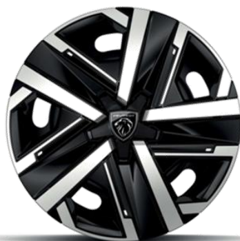
Jantes tôle 16" avec enjoliveurs SILOM Gris Eclat & Noir Orbital, vernis mat