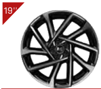
Alufelgen: VERSAILLES Code : ZHMP