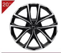
Alufelgen: MUNICH Code : ZHWX

■ : Serienausstattung / - : nicht verfügbar