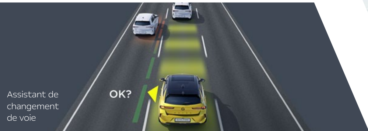
Assistant de changement de voie