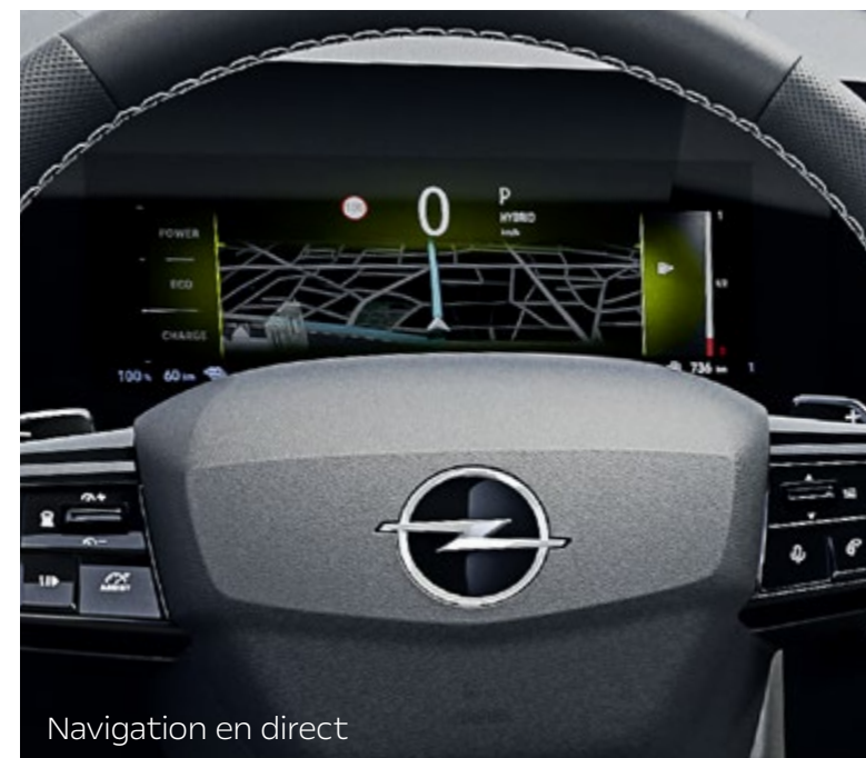
Navigation en direct

Retrouve d'autres informations concernant le système de navigation ainsi que des instructions pour l'activation des services de connectivité sur www.opel.ch