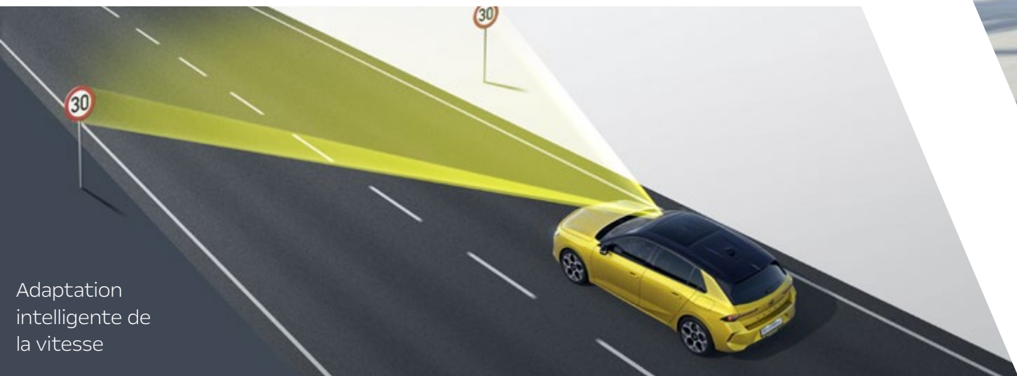
Adaptation intelligente de la vitesse