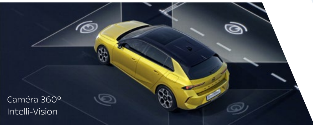
Caméra 360° Intelli-Vision