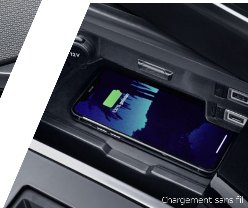
Chargement sans fil

La nouvelle surface graphique du système d'infodivertissement intègre ton smartphone sans câble, via Apple CarPlay™ 1 ou Android Auto™ 2 , réagit aux commandes vocales et simplifie la navigation en direct avec les mises à jour de cartes Over-the-Air.