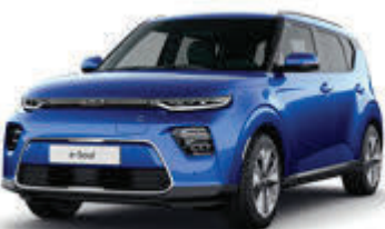
Neptune Blue (B3A)