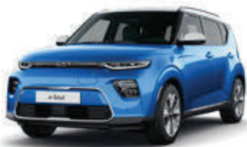
Surf Blue + Clear White (AH8)