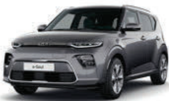
Gravity Gray (KDG)