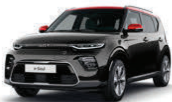
Fusion Black + Inferno Red (FA1)