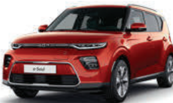
Mars Orange (M3R)