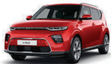
Inferno Red (AJR)