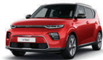
Inferno Red + Fusion Black (FA2)