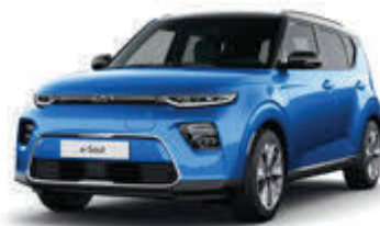
Surf Blue + Fusion Black (FB3)