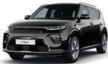
Fusion Black (FSB)