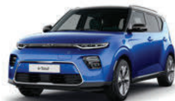
Neptune Blue + Fusion Black (FB1)