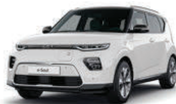
Clear White + Fusion Black (F1D)