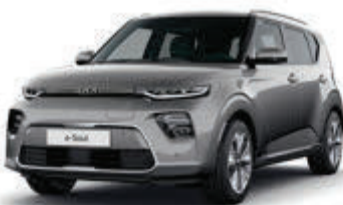
Steel Gray (KLG)