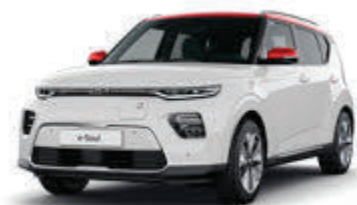
Clear White + Inferno Red (AH1)