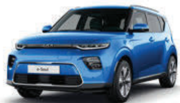
Surf Blue (SRB)