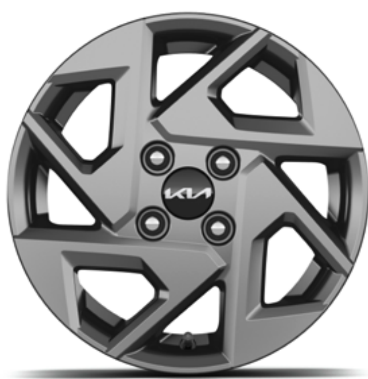
Cerchi in lega leggera da 14 pollici