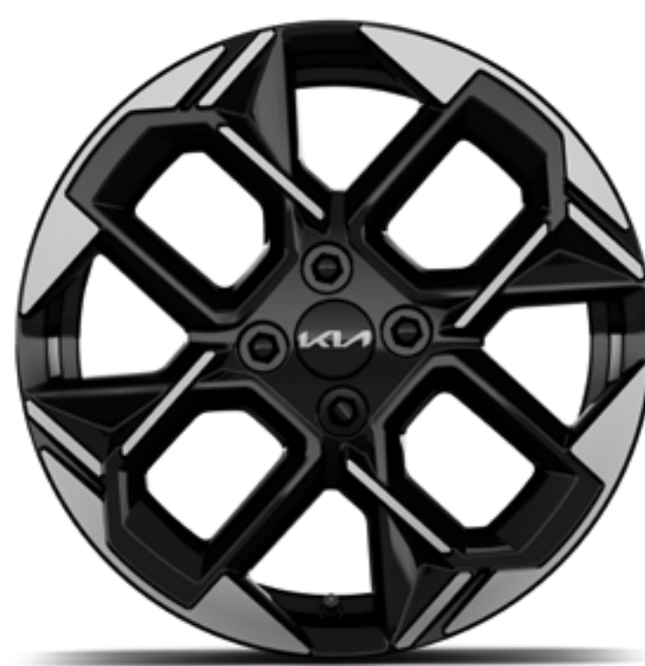
Cerchi in lega leggera da 16 pollici GT-Line