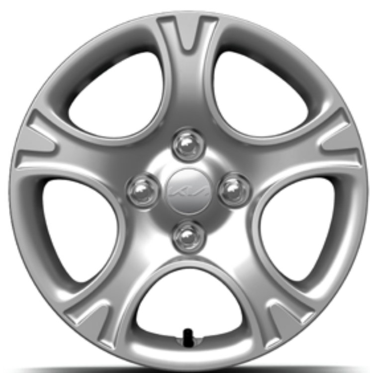
Cerchi in acciaio da 14 pollici